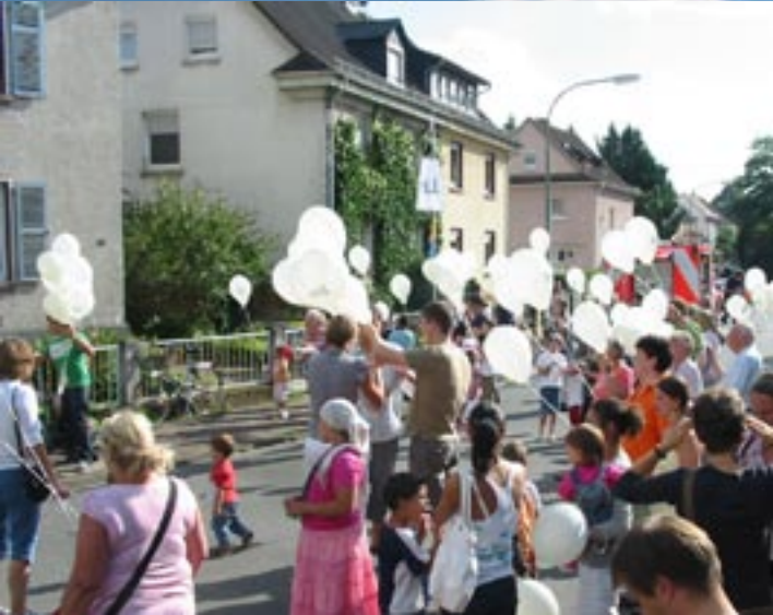
Die allererste Postkarte als Ankündigung auf das kommende Projekt. Ballon-Karten-Aktion zum Sommerfest 2008 in der Engelsruhe.